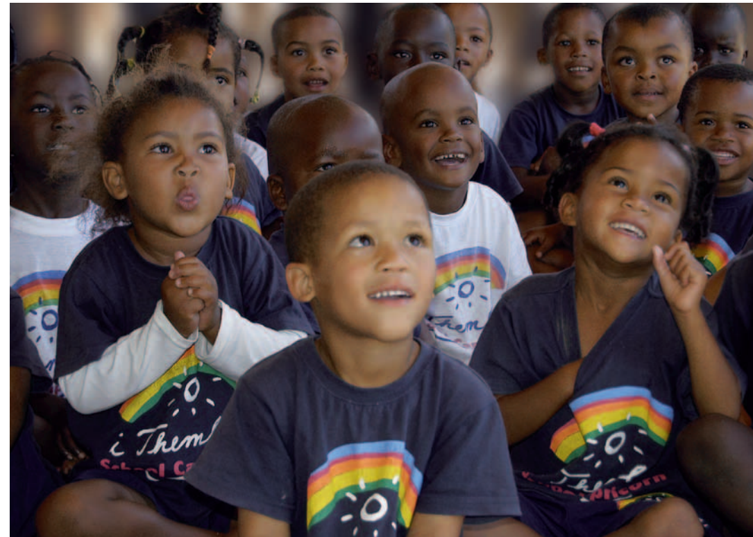
Township-Projekt iThemba School Capricorn: Kinder im Vorschulalter freuen sich über die Eröffnung ihres neuen Schulgebäudes.

Start der Beteiligung von Condor: Oktober 2003 Alle in diesem Beitrag für das Jahr 2009 genannten Zahlen sind vorläufig, da die finalen Zahlen bei Redaktionsschluss noch nicht vorlagen.